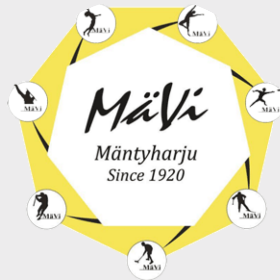
Mäntyhärjun Virkistys ry. Finland