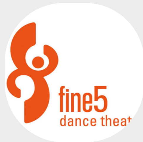
Fine 5 Dance Estonia